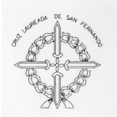
La Cruz Laureada de San Fernando era la máxima condecoración española antes de la Guerra y lo siguió siendo en el bando nacional